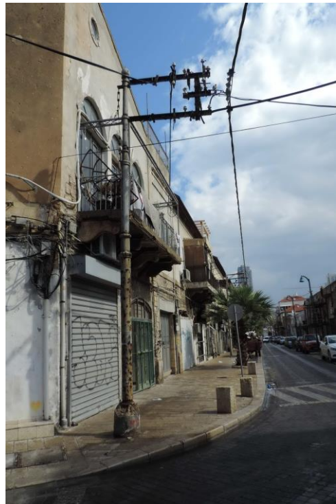
העמוד ברחוב דוד רזיאל פינת רטוש